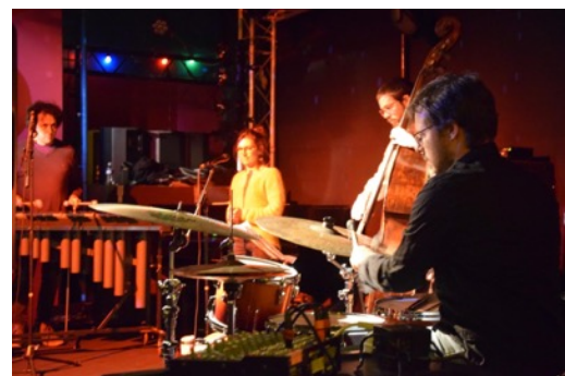
Concert au Vauban Brest - 2024